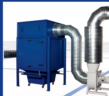
ZPF 9 H