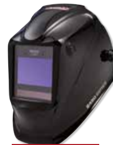
VIKING™ 2450 Black

LIEFERUMFANG: Lieferung mit Helmtasche, Halstuch, 5 äußere Vorsatzscheiben, 2 innere Vorsatzscheiben sowie Stickerbogen.