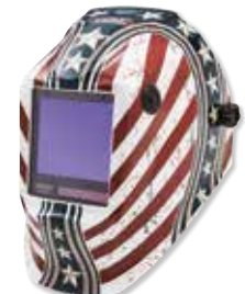
VIKING™ 3350 Dardevil