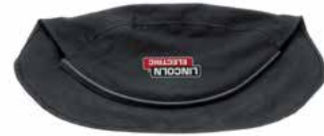
FLAMMHEMMENDE BAUM- WOLLE FÜR MEHR SCHUTZ

LINCOLN ELECTRIC Flammhemmende Baumwolle für besseren Kopfschutz, aufpressbarer Silikonverschluss