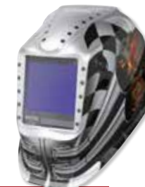
VIKING™ 3350 Motorhead™

Schleifmodus, extern über Knopf an der Helmschale für nahtlosen Übergang zwischen Schweiß- und Schleifmodus