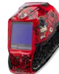
VIKING™ 3350 Mojo™