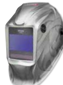
VIKING™ Heavy Metal®

Hervorragend geeignet für Arbeiten im Freien in allen Umgebungen