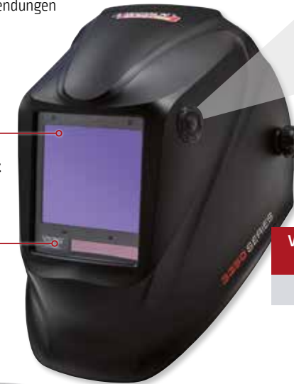
VIKING™ 3350 BlackMat